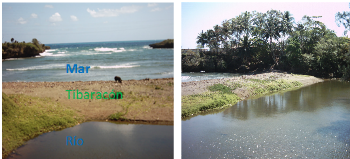
FIGURA 6. Aspectos más frecuentes de las rocas de playa: izquierda. Frente a la desembocadura del río Yacabo Abajo, sureste provincia Guantánamo: de estratos gruesos y levantadas sobre el nivel medio del mar. Derecha. Ensenada en la desembocadura del río San Juan (playa Aguadores), sur de la Sierra Maestra: de estratos finos, con su superficie al nivel medio del mar, semejando pliegues, debido a que adoptan la morfología del lugar, constituidas. Constituidas en ambos casos, principalmente, por litoclastos.

De acuerdo con la hipótesis sobre la formación de las rocas de playa en Cuba, queda claro que su origen es consecuencia de un proceso diagenético característico de ambientes marino-costeros, donde la acumulación y cementación ocurren prácticamente a la vez por la acción del mar, independientemente de la procedencia del material clástico de su constitución. Es por ello que es más apropiado considerarlas dentro del tipo genético de depósitos marinos y, no aluvio-marinos como fue propuesto por Cabrera y Batista (2009). También permite suponer que la inclinación en dirección al mar abierto de los estratos es resultado de las corrientes de resaca, las cuales arrastran y acumulan cierta cantidad del material friable al interior del mar, pero que esta es menor que la que se acumula más próximo a la costa, creándose así una superficie ligeramente inclinada, donde el aumento de su ángulo es indirectamente proporcional al tamaño de los clastos. Esto aparece bien ilustrado en el ejemplo de las desembocaduras de los ríos Yacabo Abajo y San Juan (Fig.1), en el primero, con clastos gruesos, el ángulo de inclinación es mínimo, mientras que, en el segundo, con clastos finos es, de unos 30°. Sin embargo, la causa de su división en finos estratos no está del todo clara y, podría responder a períodos eventuales de gran aporte de material clástico, por influencia de eventos meteorológicos extremos de muy corta duración.