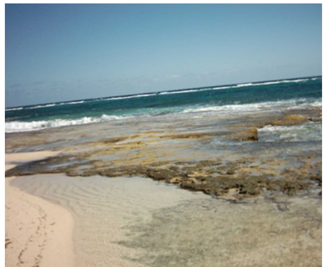
FIGURA 2. Un escenario similar al descrito al pie de la Fig.1, pero en la desembocadura del río Yumurí, al este de ciudad de Baracoa (foto izquierda), constituida por litoclastos y la desembocadura del río Maya, punta de Maisí (foto derecha), formada por bioclastos