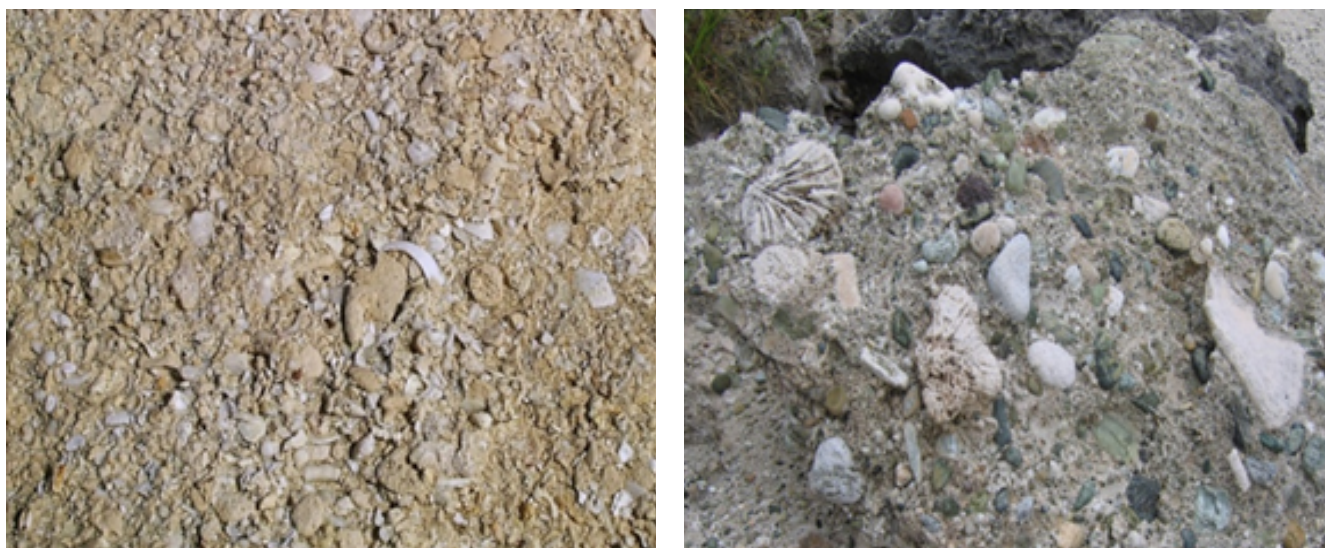
FIGURA 5. Ejemplos de composición de las rocas de playa: a la izquierda bioclastos aun con el lustre anacarado, por ser muy jóvenes, cementados por aragonito, cayo Sijú, cayería San Felipe, plataforma marina suroccidental. A la derecha litoclastos terrígenos y bioclastos marinos cementados por calcita, Imías-Cajobabo, sureste de la provincia Guantánamo.

La distribución territorial de las rocas de playa identificadas hasta el momento en Cuba responde, de manera general, a segmentos costeros de los sectores sin plataforma marina, entre los que se destacan los mencionados en las Figs.1, 2, 3, 4 y 5 (sureste y noreste de la provincia Guantánamo, norte de la provincia de Holguín y sur de la Sierra Maestra), con mayor desarrollo en las cercanías de la desembocadura de los ríos Yacabo Abajo, Imías, Tacre, Jojo y Maya. En menor grado se encuentran en algunos cayos de la zona morfogenética exterior de las plataformas marinas suroccidental (cayería de San Felipe), suroriental (cayería de Ana María) y plataforma norcentral (cayería Ciego-Camagüey), donde están constituidas por bioclastos.