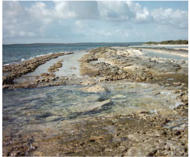
FIGURA 3. Vistas de rocas de playa, constituidas por bioclastos. Playa Morales, noreste del pueblo de Banes, provincia Holguín.