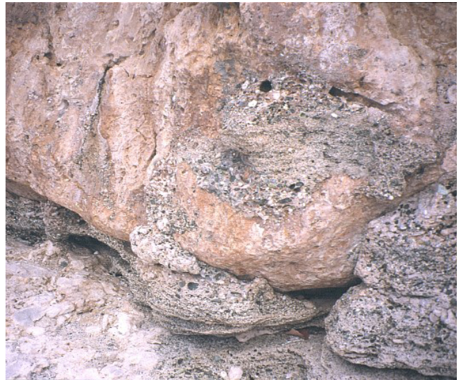
FIGURA 4. Rocas de playa en punta Guayacanes, Imías. Grandes bloques desprendido del acantilado costero y fundidos en una mezcla de gravas y arenas cementadas, semejante a un hormigón tipo mortero. Constituidas por litoclastos, aportados por corrientes marinas laterales probablemente desde la desembocadura del río Taquere, situada a 6,5 km al este.